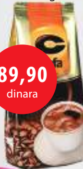
Kafa C 100g