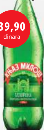
Knjaz Miloš 1,75l gazirani