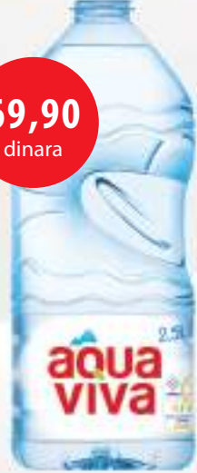
Aqua Viva 2,5l