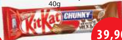
Kit Kat Chunky 40g