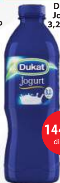
Dukat Jogurt 3,2%mm 1,5l