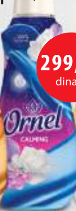
Ornel Calming 1,8l