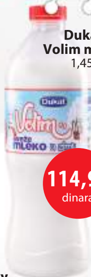
Dukat Volim mleko 1,45l