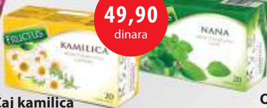
Čaj kamilica Fructus