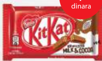
Kit Kat 41,5g