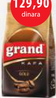
Grand kafa Gold 100g