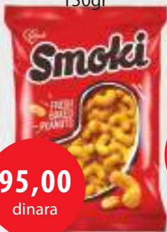
Smoki kikiriki 150gr