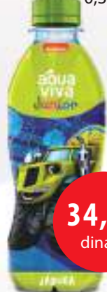
Viva Junior Jabuka 0,33l