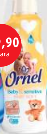
Ornel Baby&Sensitive Aloe 1,8l