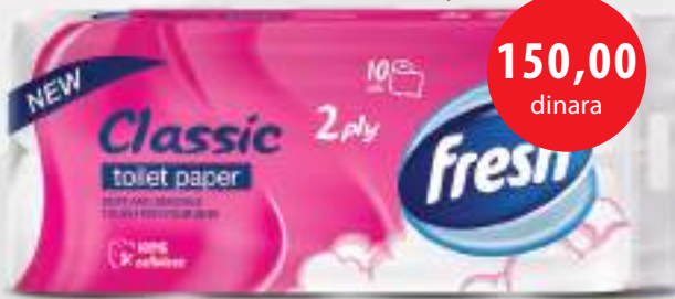
Fresh classic toaletni papir 2 sloja 10/1