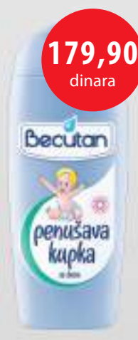
Becutan kupka za decu 200ml