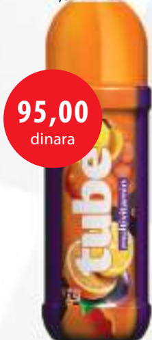
Knjaz TUBE multivitamin 1,5l